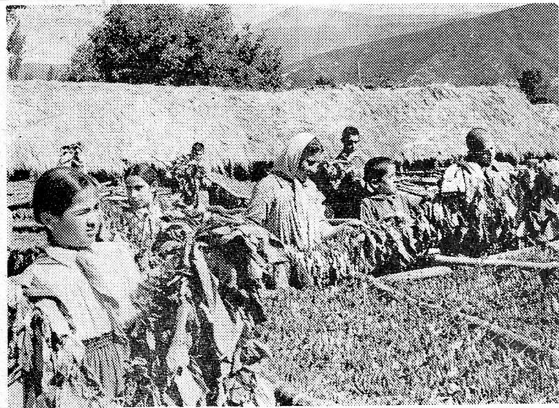
Нуха II №-ли орта мәктәбин шакирдләри Киров адына колхозда түтүн яриағыны гурутмагда колхозчулара көмәк әдирләр.

вә я башга бир истеһсалатла үмүми сурәтдә таныш әтмәйә кифайәт әдәр. Һалбуки XX гурултай тәлимилә шакирдләрин мәнсулдар әмәйинин бағланмасы проблемини һәлл әтмәйи биздән тәләб әдир. Бу вәзифә исә о заман еринә етирилә биләр ки, шакирдләр тәһсил алмагла паралел олараг һәм дә мәнсулдар әмәклә