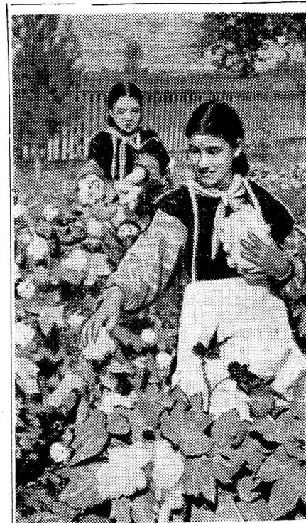
Ағдаш району Хосров кәнд орта мә- ктәбинин шакирдләри кечән илки мөв- сүм заманы памбыг мөһсулуну йығар- кән колхозчулара көмәк этмишләр. Һәмин кәнд мәктәбинин шакирдләри бригада тәшкил эдәрәк йүксәк памбыг мөһсулу етиширмәкдә бу ил дә кол- хозчулара көмәк эдирләр.

Бу мәктәпләрдә тәшкил эдилән эмәйин һәлә һеч бирини әсл мәнә- сында тәлимлә әлагәләндирилән мөһсулдар эмәк адландырмаг мүм- күн олмаса да мәктәпләрдә бу кими ишләрин әсл мөһсулдар эмәк истига- мәтиндә ирәлиләдийинә һеч бир шүбһә йохдур вә биз бу чүр тәдбир- ләри анчаг алгышламалыйыг.